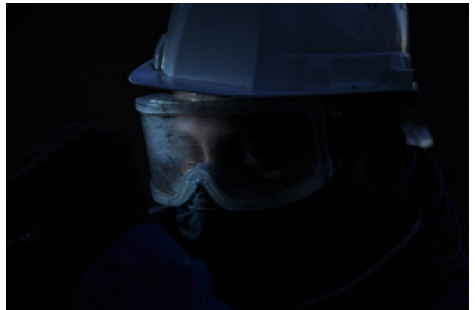
Vorago Vidéo, 9min, 2013 / 2015