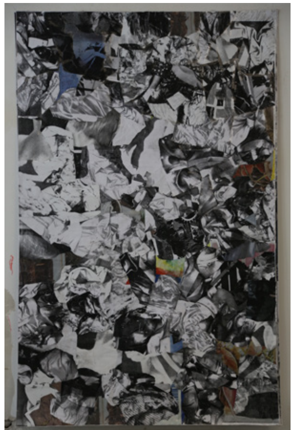
Sans Titre Photocopie noir/blanc et scotch, 168cm x 198cm

En déchirant, assemblant, scotchant et collant tous les A3 qui sortent de sa photocopieuse, elle construit des images de deux mètres de haut minimum tel des grandes portes ouvertes sur un monde imaginaire composé des restes du nôtre.