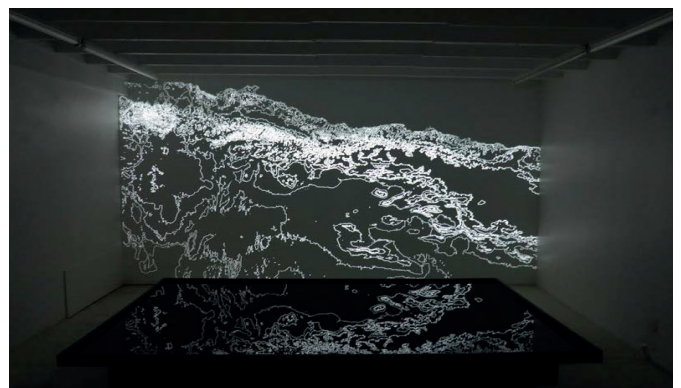
Sillage , 2012-2015 Données sismiques (Chili, 15h12, 12/03/2008, 18min), dispositif sonore, vidéoprojection bac en bois, encre de chine,