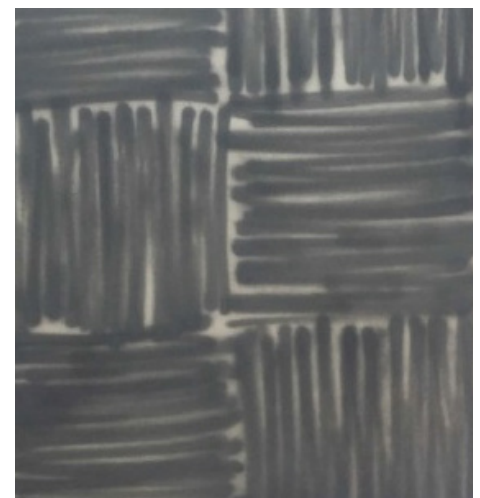
Sans titre, 2015 Spray acrylique sur toile 180 x 120 cm

Il a notamment exposé au Générateur à Gentilly, dans la galerie Pollock à Dallas, ainsi qu'à Minatomachi Art Table à Nagoya.