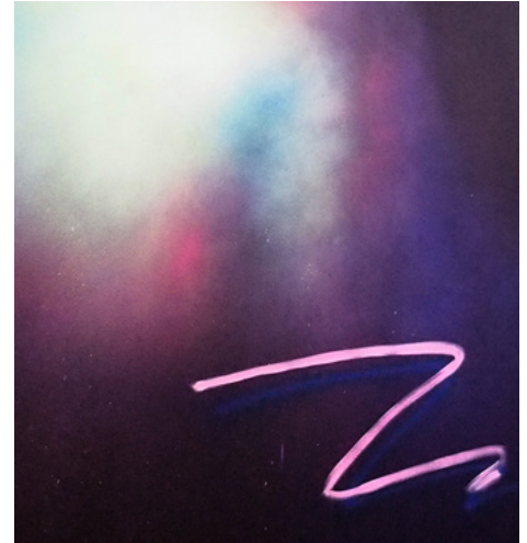
There is no easy way out, 2015 Spray acrylique et acrylique phosphorescent sur toile. 200 X 180 cm.

Nicolas Rouah a été nommé deux fois pour le Prix International de peinture et travaille actuellement à Dijon.