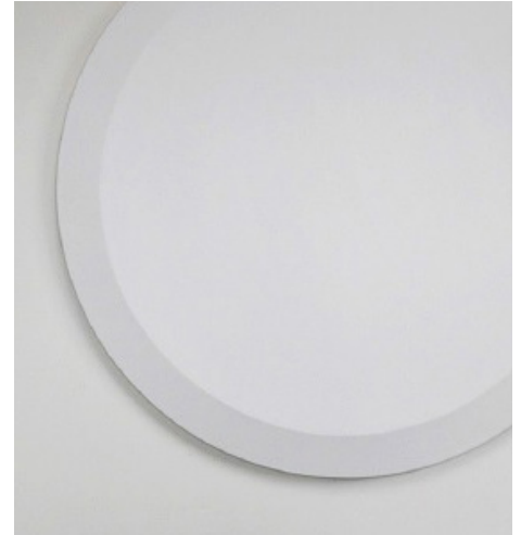
Sans titre, 2016 Peinture garnissante veloutée aux résines alkydes en solution sur toile 129cm (diam.) x 5 cm

Résidence : 2012 (jun-sep), recherche et production, Centre d'Art Contemporain, Fabrikculture, Hégenheim, France