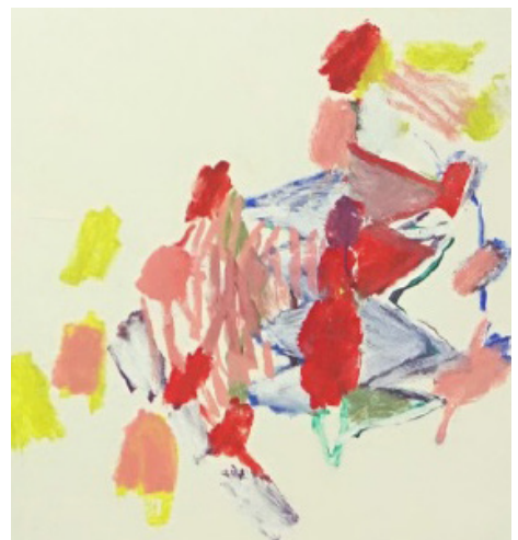
Nue, 2015 Acrylique, glycéro, colle à papier peint sur drap 110 x 80 cm