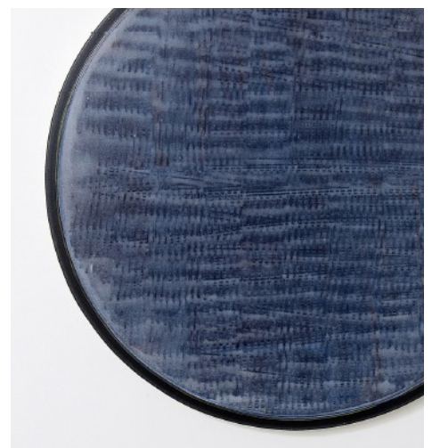
Microfilm, 2015 Acrylique et vernis sur toile 100 cm (diam.) © Nicolas Waltefaugle 2015

“Investir le bord du tableau, comme vous le faites de manière récurrente, renvoie à des enjeux déterminants de l'histoire de l'art. Il est habituel de considérer que le bord présente une valeur moindre par rapport à ce qui apparaît au centre. Mais une telle hiérarchisation ne va pas de soi. Car cet espace, où s'établit une frontière entre le tableau et ce qu'il n'est pas, peut aussi se révéler synonyme de brisure, de violence. Chez Seurat, par exemple, la limite extérieure de la peinture s'apparente à une découpe arbitraire qui est source de souffrance.” Pierre Tillet.