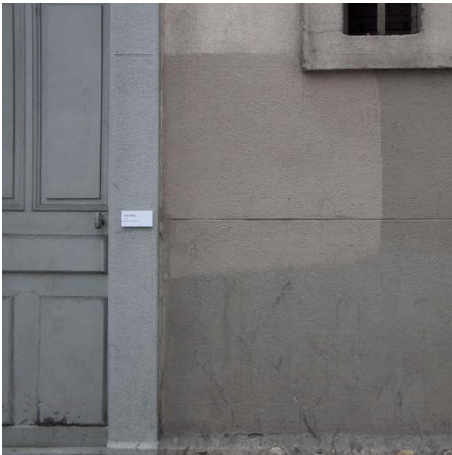
Hugo Capron Tout juste diplômé des beaux arts de Dijon, hugo né en ?? il présente une vidéo du festival Global Groove...