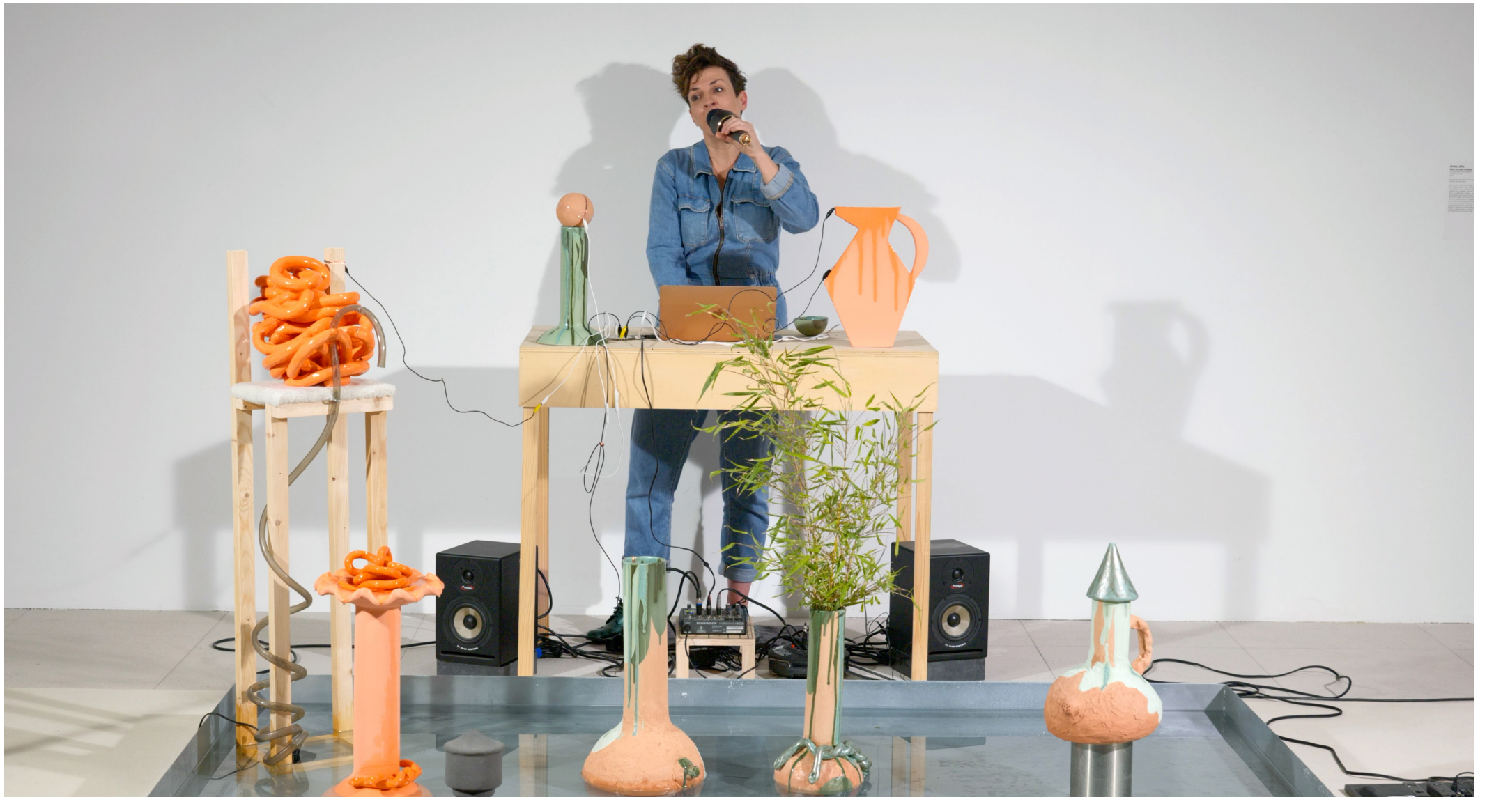
«Coule», performance à la Fondation François Schneider dans le cadre de l'exposition collective « La mécanique de l'eau », 2024