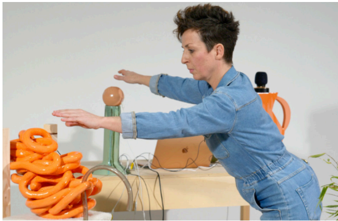
«Coule», performance à la Fondation François Schneider dans le cadre de l'exposition collective « La mécanique de l'eau », 2024 © Christophe Monterlos