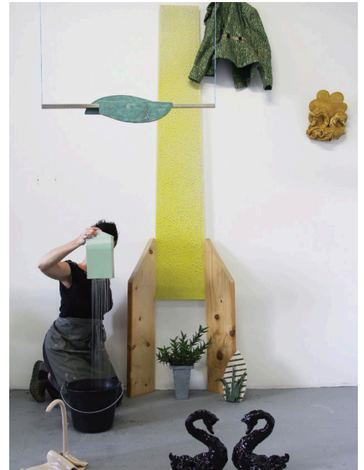
Action domestique, Action confinée à l'atelier, 2020 © Cecile Meynier