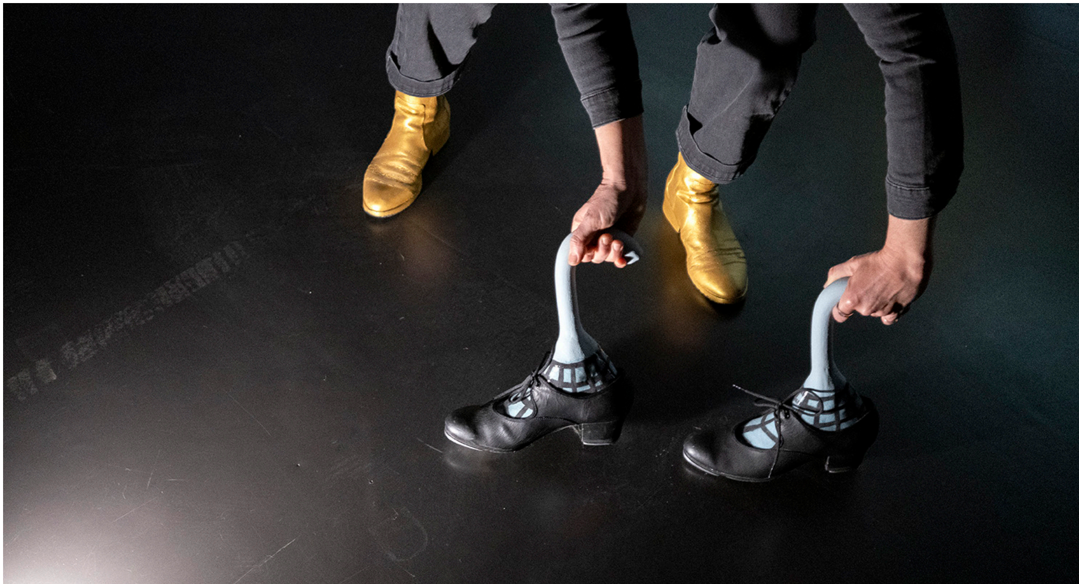
«La danseuse en chasse neige», concert performatif FRAC Franche-Comté, Besançon, 2025