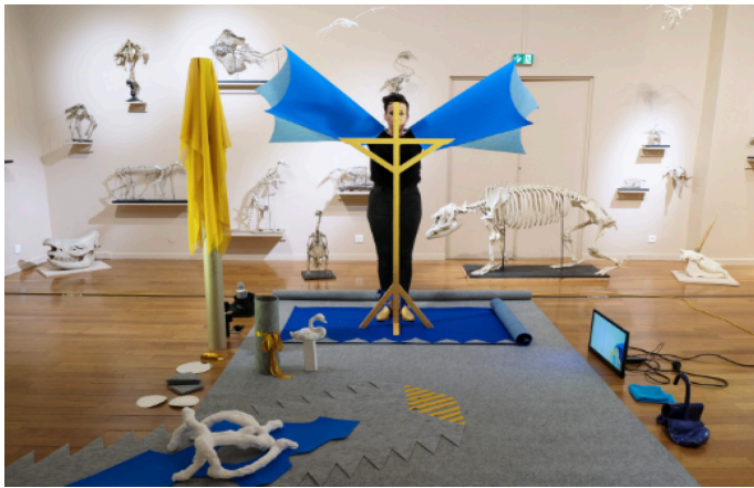
Carnaval animal, performance, Musée de Montbéliard, programmation CRAC le 19, 2022