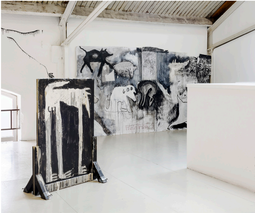
Grishka Tchernishoff, Exposition «Zweifuß», Les ateliers vortex, 2026