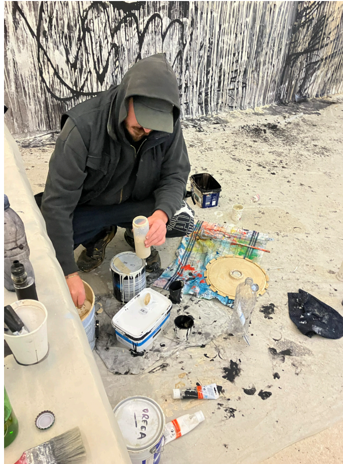
Grishka Tchernishoff, Vues d'atelier, Résidence 2026