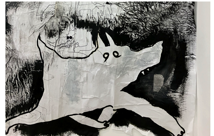
Grishka Tchernishoff, Vues d'atelier, Résidence 2026