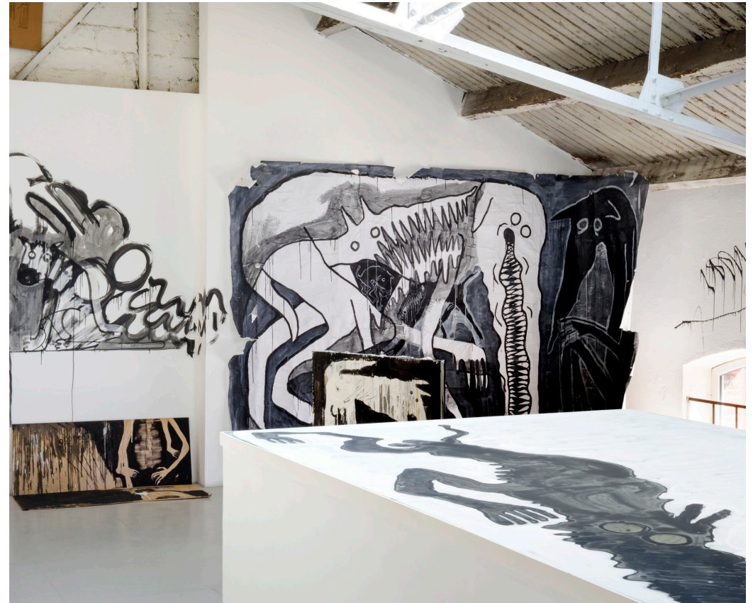
Grishka Tchernishoff, Exposition «Zweifuß», Les ateliers vortex, 2026