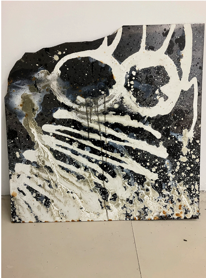
Grishka Tchernishoff, Vues d'atelier, Résidence 2026