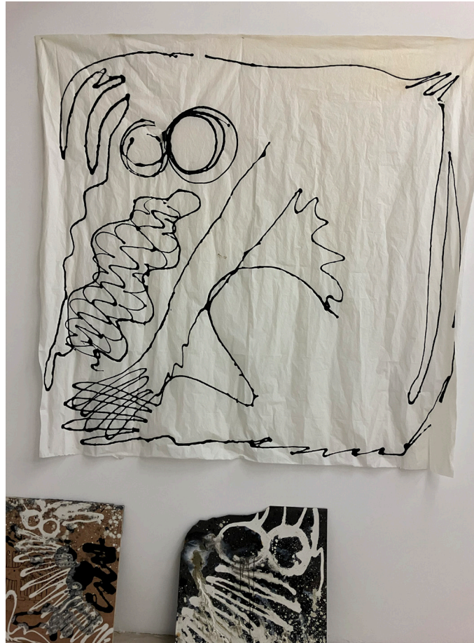
Grishka Tchernishoff, Vues d'atelier, Résidence 2026, © Les ateliers vortex