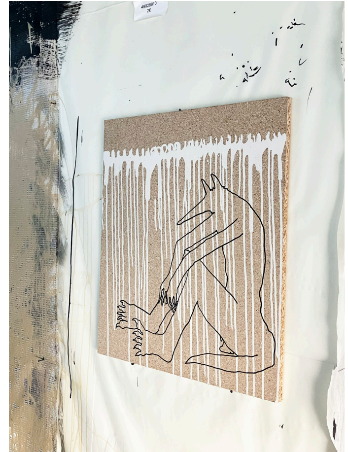
Grishka Tchernishoff, Vues d'atelier, Résidence 2026, © Les ateliers vortex