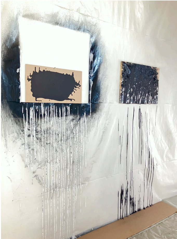
Grishka Tchernishoff, Vues d'atelier, Résidence 2026