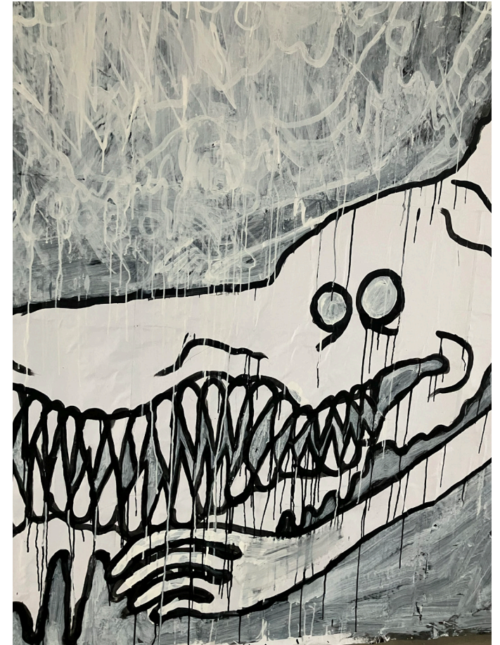
Grishka Tchernishoff, Vues d'atelier, Résidence 2026